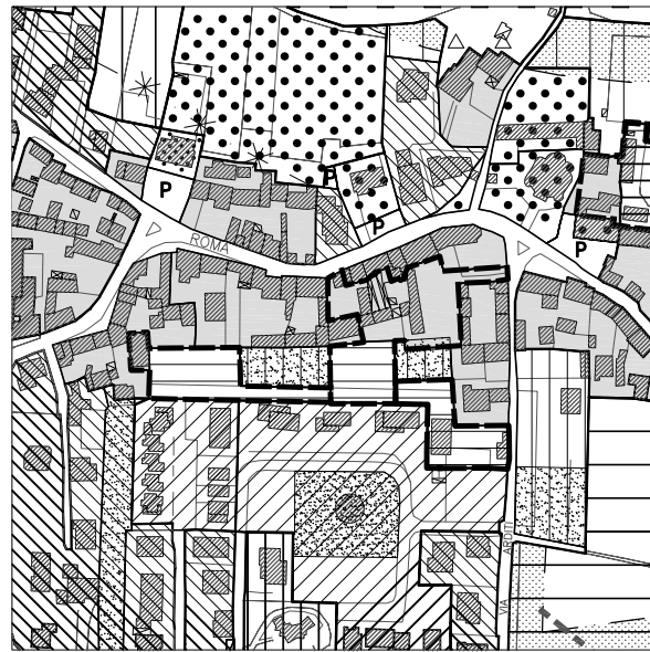
Estratto Tavola 13.1, scala 1:5000 Estratto Tavola 13.3.1., settore N-E: Moriago, scala 1:2000 con evidenziati i fabbricati da demolire, Tavola Progetto Norma, scala 1:1000

Il PNA 6 fa parte di un progetto di più ampio ridisegno del tessuto urbano che include anche il PNA 5 e il PNC 10 in modo da dare un disegno unitario al tessuto urbano ricreando degli spazi ad uso pubblico collegati da un percorso pedonale che porta a Piazza della Vittoria. L'area di progetto è stata suddivisa in varie unità minime di intervento. Per quanto riguarda gli edifici esistenti gli interventi sono regolamentati dalle schede norma n° 82/88/89/91/92/93. All'interno del perimetro di progetto si prevede la costruzione di nuovi edifici ad uso residenziale.