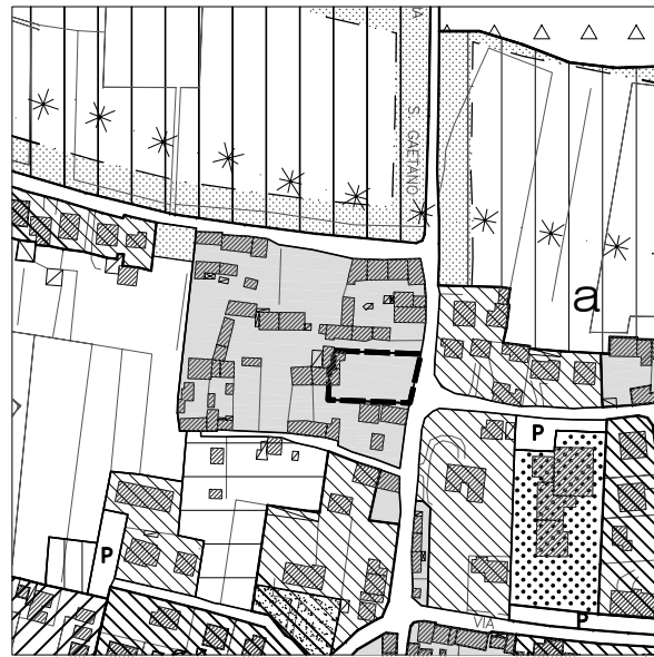
Estratto Tavola 13.1, scala 1:5000 Estratto Tavola 13.3.1., settore N-E:Moriago, scala 1:2000 Tavola Progetto Norma, scala 1:1000

Il PNA 3, di iniziativa privata, propone la riqualificazione di un'area del centro storico di Moriago. L'intervento prevede la creazione di un'area di uso pubblico lungo via S. Gaetano mediante il mantenimento dell'alberatura esistente, la sistemazione dell'area verde, la sistemazione lungo il lato est del marciapiede e il recupero delle tracce dell'edificato che si trovano lungo il lato nord-est del perimetro del PN in modo da realizzare un punto di "sosta-belvedere" pavimentato e attrezzato con panchine. Il PNA3 prevede inoltre il recupero dei fabbricati esistenti e la realizzazione di un nuovo fabbricato ad uso residenziale che, rispecchiando la tipologia tipica del luogo, completi la trama del tessuto edificato esistente. L'edificio verrà collocato, come evidenziato nella tavola di progetto, in modo da creare una corte privata delimitata da muri in sassi con aperture che garantiscano il contatto con l'esterno.