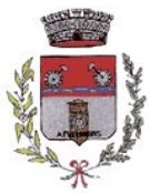
Comune di Follina