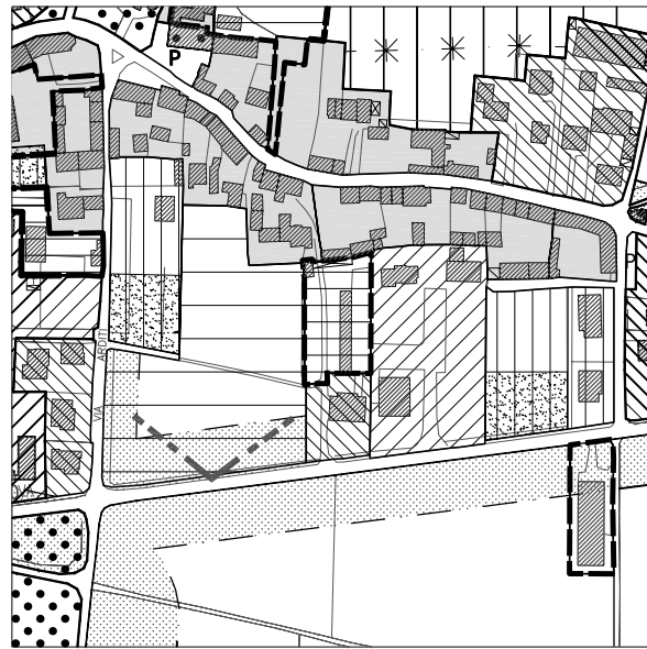
Estratto Tavola 13.1, scala 1:5000 Estratto Tavola 13.3.1., settore N-E:Moriago, scala 1:2000 con evidenziati i fabbricati da demolire, Tavola Progetto Norma, scala 1:1000

Il PNC 9 interessa un'area di interconnessione tra il centro storico di Moriago e la direttrice viaria di via Brigata, limite di espansione verso sud dell'edificato per l'intero comune. L'area d'intervento è già inquadrata dal precedente P.R.G. come area residenziale di espansione su cui attualmente insite un fabbricato a destinazione d'uso produttivo la cui attività dovrà essere trasferita. Il PN prevede un intervento di ristrutturazione urbanistica mediante la demolizione dell'edificio precedentemente menzionato e delle baracche lungo il lato nord dell'area di progetto. La volumetria degli edifici demoliti verrà recuperata nelle nuove case singole o bi-familiari. Inoltre è prevista una fascia di area a verde pubblico con un percorso pedonale che colleghi direttamente al centro storico. Un filare di alberi ad alto fusto segue il percorso pedonale e funge da limite con l'area non edificata. Lungo il lato sud dell'area di progetto sono previsti dei parcheggi pubblici che soddisfino anche il fabbisogno degli edifici adiacenti.